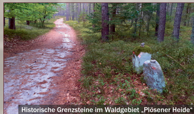
Historische Grenzsteine im Waldgebiet „Plösener Heide“

Damit diese lokalhistorischen Besonderheiten entlang der „Alten Handelsstraße“ nicht in Vergessenheit geraten, informieren insgesamt 10 Informationstafeln entlang des Weges darüber, was es mit den alten Steinkreuzen und vielen weiteren Besonderheiten auf sich hat.