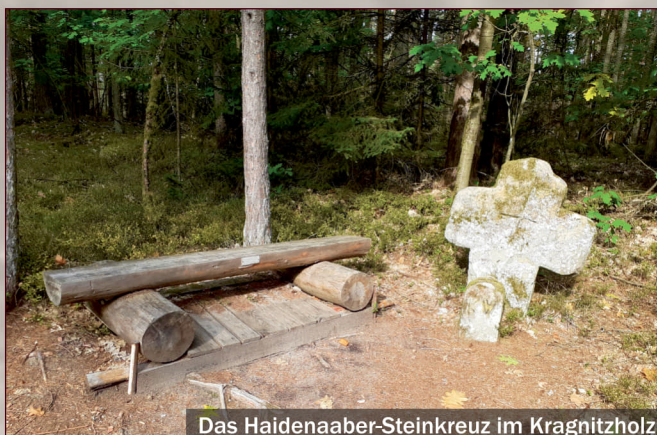
Das Haidenaaber-Steinkreuz im Kragnitzholz

Nach den Feststellungen verschiedener Heimatforscher soll der Weg eine Heer- und Handelsstraße gewesen sein, die in West-Ost-Richtung verlief und den fränkisch-thüringischen Raum mit dem bayerisch-böhmischen verband. Im Volksmund wird der Straßenabschnitt auch „Pfälzerstraße“ oder „Pfälzer Handelsstraße“ genannt.