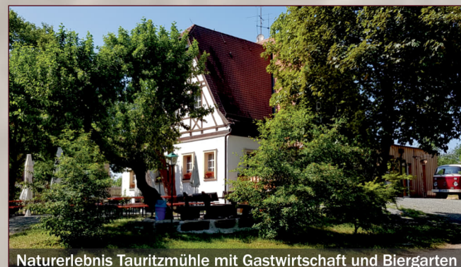
Naturerlebnis Tauritzmühle mit Gastwirtschaft und Biergarten

Besonders ab dem späten 13. Jahrhundert war es üblich, zur Sühne für Bluttaten steinerne Kreuze zu errichten. Die wahren Begebenheiten sind trotz umfassender Recherchen zahlreicher Lokalhistoriker nicht immer eindeutig auszumachen. In jedem Fall ranken sich jedoch zumindest Sagen und Legenden um die stillen Steinzeichen, welche nun entlang des Weges dokumentiert sind.