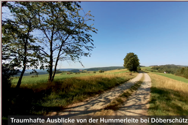
Traumhafte Ausblicke von der Hummerleite bei Döberschütz

Wer hier unterwegs ist, wird zahlreiche Kleindenkmäler entdecken. Besonders markant sind das Steinkreuz auf dem Lessauer Berg oder das Haidenaaber Kreuz an der sogenannten Steinkreuzhütte, von der aus der Weg zur Tauritzmühle durch weitere historische Grenzsteine gesäumt wird. Die Denkmäler entlang des Weges zeugen davon, dass hier einst eine alte Handelsstraße verlief, die wahrscheinlich schon in vorgeschichtlicher Zeit bestand.