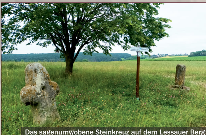
Das sagenumwobene Steinkreuz auf dem Lessauer Berg

Im Süden bietet sich ein Blick bis in die Hersbrucker Schweiz. Im Kragnitzholz führt der Weg an der Steinkreuzhütte und den Bärenlöchern vorbei, ehe die Tauritzmühle zur Einkehr lädt.