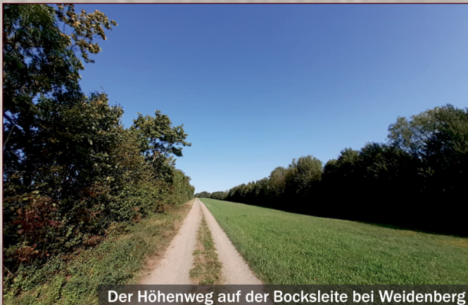
Der Höhenweg auf der Bocksleite bei Weidenberg

Der Themenwanderweg „Alte Handelsstraße“ gehört sicherlich zu den schönsten Wanderwegen in der Region. Er beginnt in Untersteinach und führt über Görau, die Bocksleite und den Fenkenseeser Berg hinein in das Kragnitzholz und über die Tauritzmühle bis nach Haidenaab.